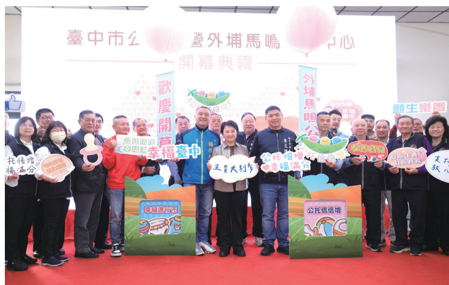
臺中外埔首座公托「馬鳴托嬰中心」開幕

社會局說明，「外埔馬鳴托嬰中心」坐擁綠意盎然的田園風光，以日間托育為主，提供專業托育人員照顧 16 名 0 歲至 2 歲幼兒，收托時間為週一至週五上午 8 時到下午 6 時。家長可申請托育費用補助，滿足臺中市設籍 0 歲到 2 歲嬰幼兒的父母或監護人的需求。