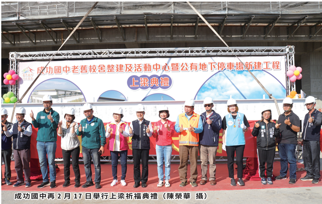
成功國中再 2 月 17 日舉行上梁祈福典禮