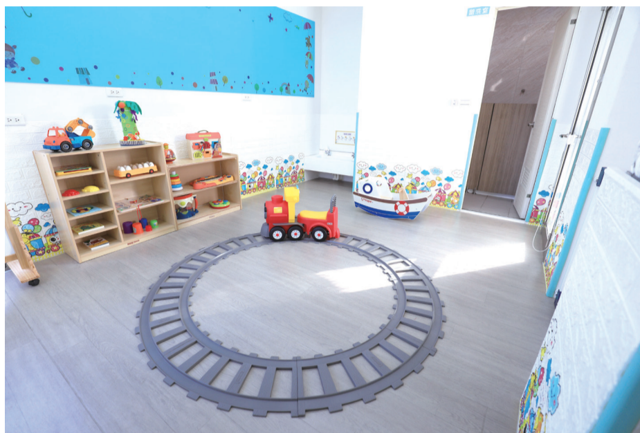
「馬鳴托嬰中心」環境設施符合國家標準，為幼兒的安全提供有力的保障