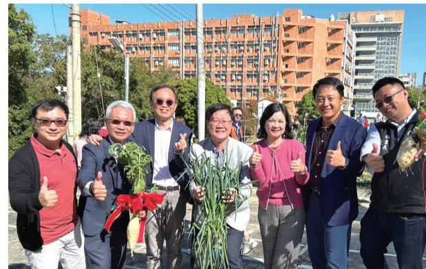
中臺科大校長陳錦杏 (右 3) 與校友總會及學校師長參與「中臺好彩頭」拔蘿蔔活動

此外，中臺科大於當日也舉行校長陳錦杏續任暨新任主管布達典禮。陳校長與所有主管皆充滿信心，面對未來複雜多變的挑戰，將致力使中臺科技大學成為醫護專業、智慧管理、民生科技兼備的頂尖科技大學。