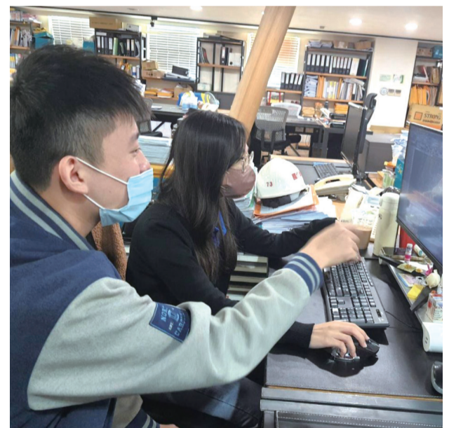
青年在公司前輩的專業指導下，展開紮實的實習