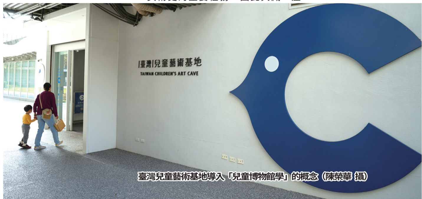
臺灣兒童藝術基地導入「兒童博物館學」的概念

再者，她強調了「多元」，國美館將致力於展現臺灣文化的充沛活力、多樣性與豐富性。這包括典藏的內容、展覽型態的多元化，以及對服務對象的擴大，努力實現文化平權。美術館將舉辦各種形式的展覽活動，如主題策展、個展等，展示不同時期、不同風格的藝術作品，呈現臺灣藝術的多樣性。