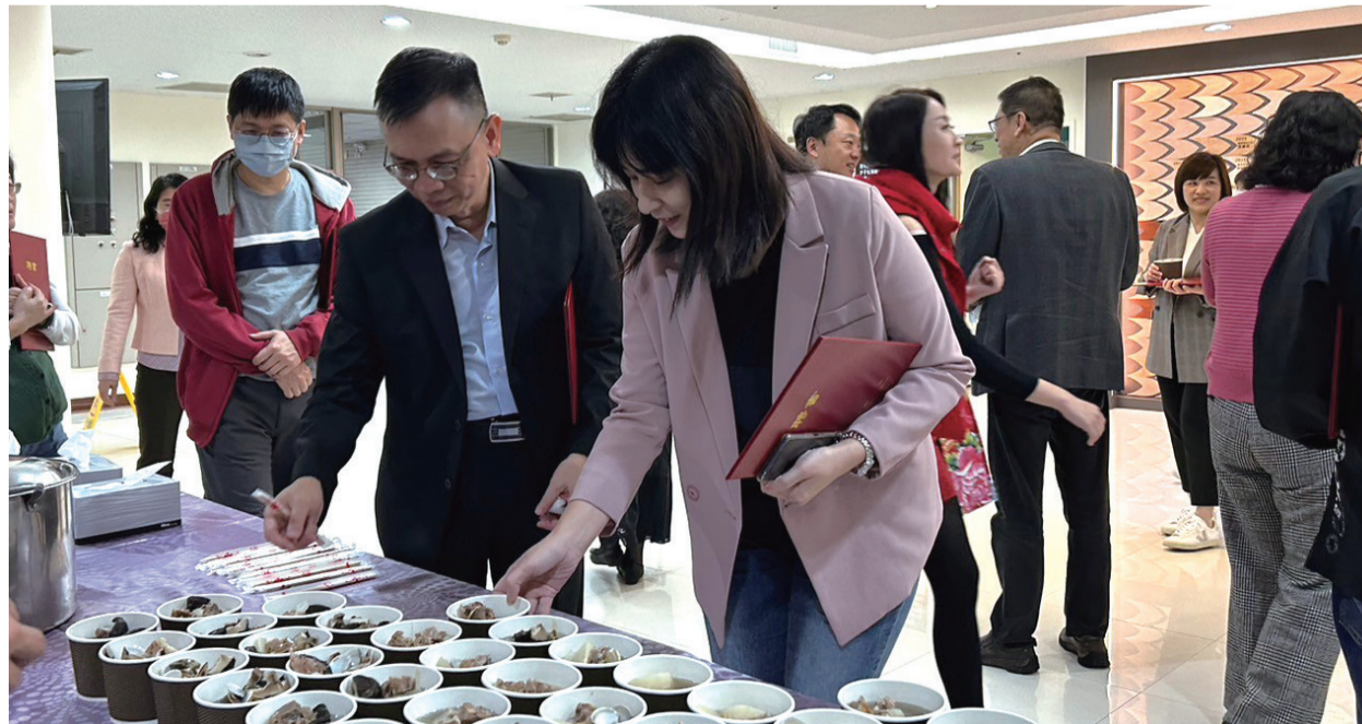
中臺科大教職員品嚐美味的蘿蔔貢丸湯

中臺科大所規劃的多元生態農園，不僅符合學校教育目標，更貼近聯合國永續發展目標 (SDGs)，透過活動強化學校與社區之間的聯繫，促進對於「SDG 11 永續城鄉和社會」的認識，並藉由實作體驗倡導「SDG 12 負責任消費與生產」理念，為學校、社區的永續發展注入新動力。