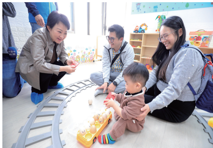
盧市長與市府團隊致力減輕父母育兒的負擔