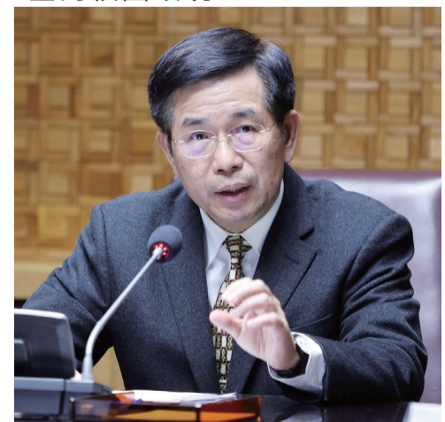
教育部召開校園安全諮詢會第二次會議（潘文忠部長）

教育部表示，將統整本次會議諮詢的意見，未來將視學校現場實務需求進行進一步研議評估，以建構更為安全的校園環境。