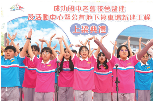
圖 成功國中學生合唱團獻唱優美歌聲，讓人如癡如醉

此外，陳局長也表示，為實現市長盧秀燕「富市臺中，行人好行」的願景，建設局將積極推動公共空間共享計畫，未來將在各級公共工程中（包括學校、運動中心及公務辦公大樓）規劃公有地下停車場，以解決停車位不足的問題，同時也將為市容美化帶來正面效益，助力臺中成為更宜居的城市。建設局將堅守工程品質及進度，力求早日完成，實現地方期望。