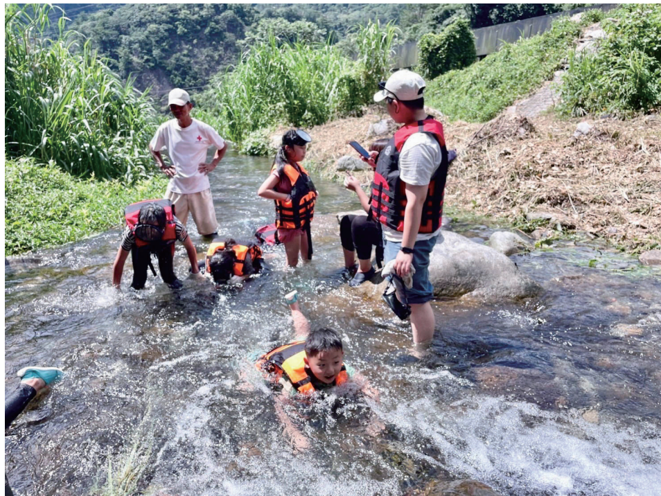
德芙蘭國小學生學習溪流踏查學習防災觀念