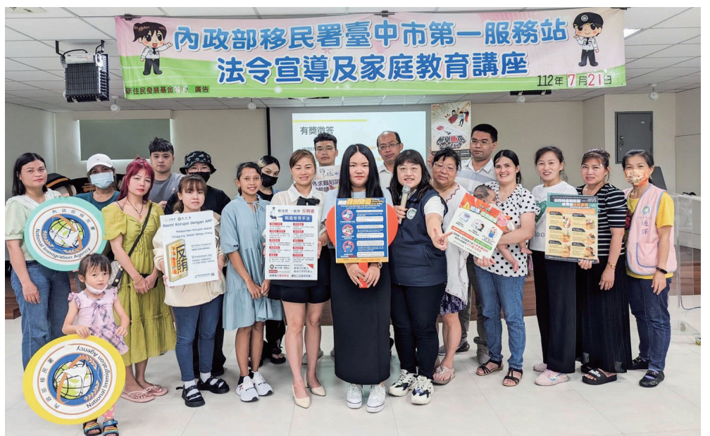
移民署臺中市第一服務站辦理新住民法令宣導及家庭教育講座活動學員 (本報資料)

該網頁提供臺灣人學習越南語的機會，同時能深入了解越南文化。最初，她製作簡單易懂的中越文圖卡，解釋常見的新住民法律、文化及商業貿易相關名詞，並錄製分解拼音，方便讀者學習。後來，網頁進一步擴充，新增越南特色美食、景點介紹，以及在臺灣的越南人故事等，增加學習的樂趣與趣味性。