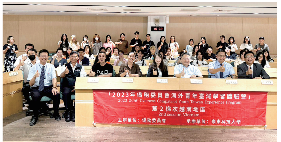
2023 僑務委員會海外青年臺灣學習體驗營越南團始業式

拓展國際學生的招生，目前越南籍學生逐年增加。這次的體驗營活動，學校結合嶺東中學及在地知名企業，申請辦理智慧製造相關的產學攜手合作計畫僑生專班，提供學子們更多發展的機會。