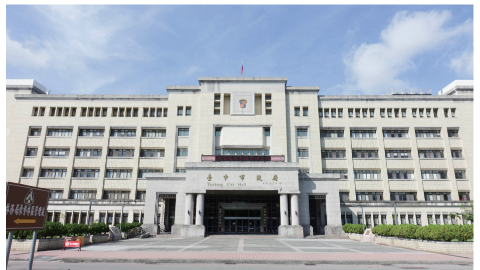
臺中市教育局

蔣局長提到最近的 #Me Too 運動正好是一個契機，讓那些可能犯錯的人思考他們的行為，並且提醒大家即使是 30 年後，他們的行為仍然可能被檢視。他呼籲人們要在行動之前深思並保持警惕。